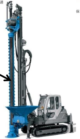
エコジオ工法の施工機（小型地盤改良機）